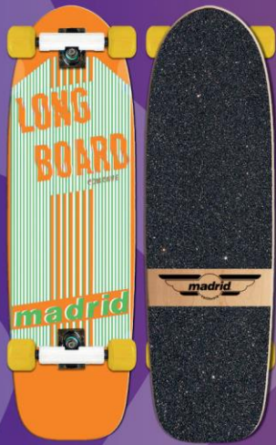
MADRID LONGBOARD RETRO 36" ORANGE