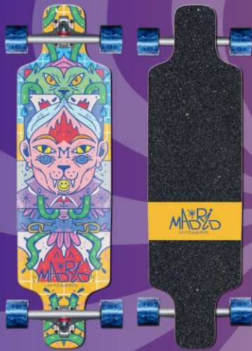
MADRID LONGBOARD DTF 36" ADRIÀ

Das Trance ist aufgrund seiner geradlinigen, symmetrischen Form und der großen Reitplattform seit Jahren einer unserer beliebtesten Longboard-Shapes. Dieses Board ist perfekt für Fahranfänger, die ein stabiles Setup mit viel Manövrierefreiheit und viel Radfreiheit wünschen, um Radbiss zu vermeiden.