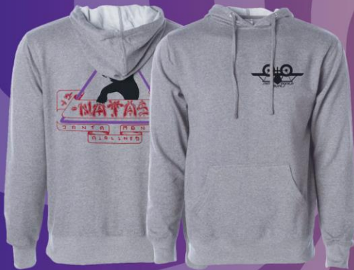
SANTAMONICA LIMITED EDITION HOODIE