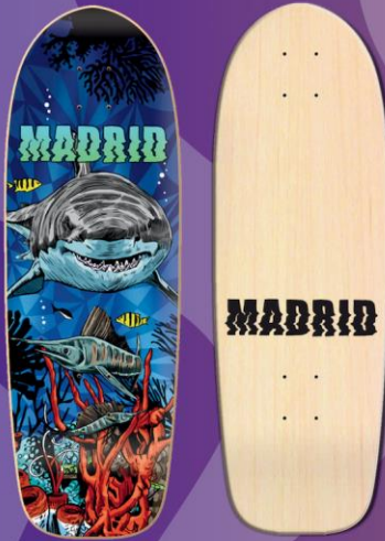
MADRID MARTY DECK 29.25" HAIFISCH