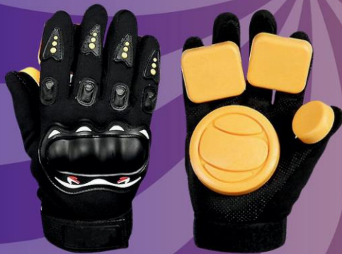
MADRID DOWNHILL HANDSCHUHE ONE SIZE