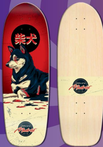
MADRID MARTY DECK 29.25" SHIBA