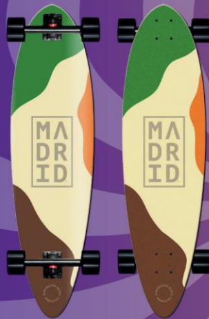
MADRID LONGBOARD BLUNT 36.25" DESERT

Das Madrid Longboard 36 war das erste Longboard mit modernem Concave und Kicktail! Die Form erinnert stark an die eines klassischen Skateboards und ist perfekt für Fahranfänger. Ursprüngliches Erscheinungsjahr: 1982