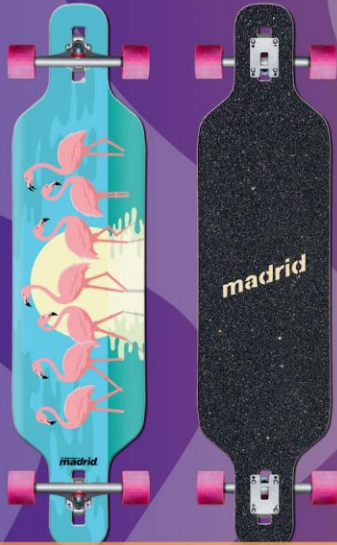
MADRID LONGBOARD TRANCE 40" FLAMINGOS