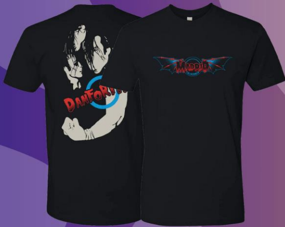
BILL DANFORTH T-SHIRT