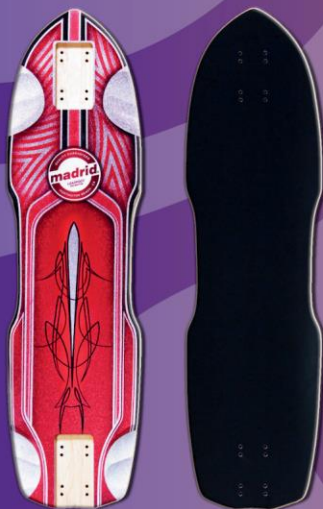
MADRID PRO SERIES LEADFOOT PINSTRIPE 32.375" ZAK MAYTU

"Ein großer Einfluss, der mich inspiriert, sind alle asiatischen Stile des Kunsthandwerks. Die Kunst ist sehr akribisch und die Künstler stecken ihr Herzblut in jedes noch so kleine Stück. Ich baue alle meine Tierfiguren auf verschiedenen Symbolen oder Göttern auf, die in der asiatischen Kultur zu finden sind." -Künstler Marc Clenn