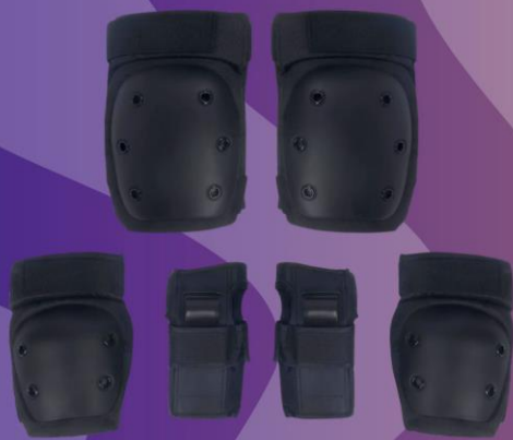
MADRID SKATE PROTEKTOREN 3-teiliges Set