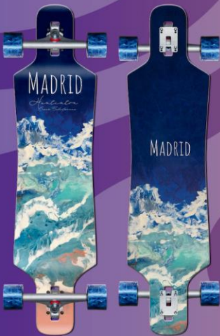
MADRID LONGBOARD SPADE 39" TIDAL

Das Blunt ist ein klassisches, vom Surfen inspiriertes Pintail, das die Wellen auf den Beton bringt, während du auf der 36,25"-Plattform carvst und rollst. Dieses Board ist mit der "Desert"-Grafik auf der Ober- und Unterseite versehen und wurde für raues Gelände entwickelt.