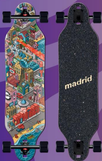
MADRID LONGBOARD WEEZER 36" MADRID CITY

Das DTF 36" verfügt über eine absenkbare Konkave mit einer geräumigen 9,75" breiten Plattform, die ein niedriges und stabiles Fahrgefühl bietet. Dieses Board besteht aus 8 Lagen Ahorn und ist auf Langlebigkeit und Leistung bei hohen Geschwindigkeiten ausgelegt.