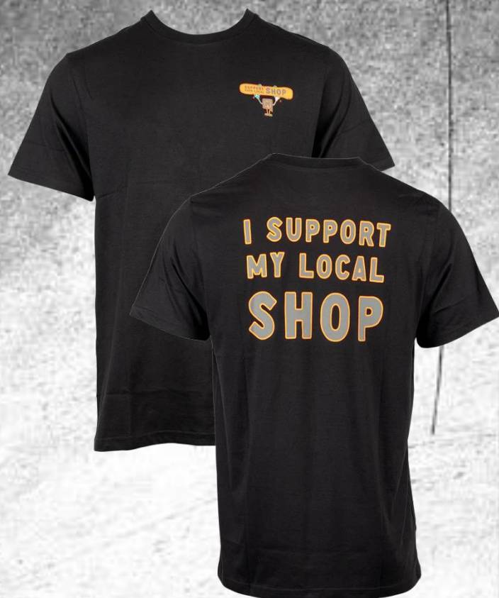
T-Shirt Support Local Tee