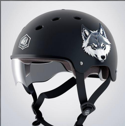
Black Wolf Skater Helm Grössenverstellbar