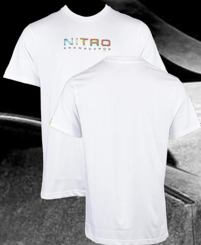
T-Shirt Nitro Team Tee