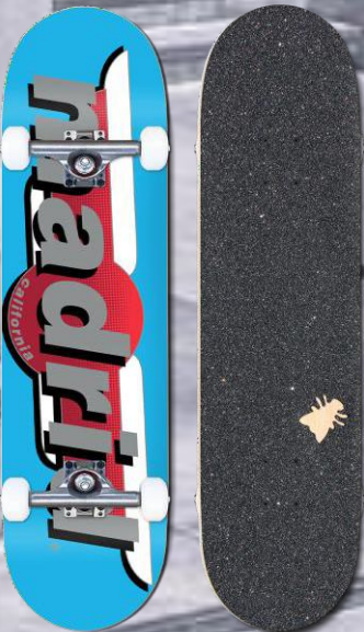
Madrid Skateboard Retro 8.25' Wings Blue