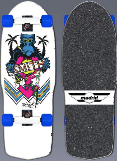
Madrid Skateboard Retro Mike Smith Affe