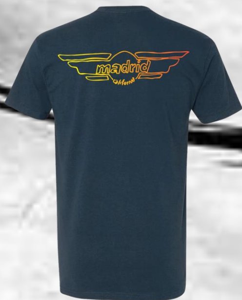
Wings Logo T-Shirt Indigo