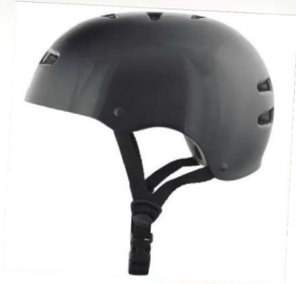
Madrid Skater Helm Grössenverstellbar