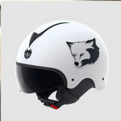
White Wolf Skater Helm Grössenverstellbar

Alle Helme verfügt über eine vergrößerte Rückwand, die vollen Schutz bis zum Nacken bietet, was besonders für Anfänger von Vorteil ist, die ihre ersten Drop-Ins von einer Rampe versuchen.