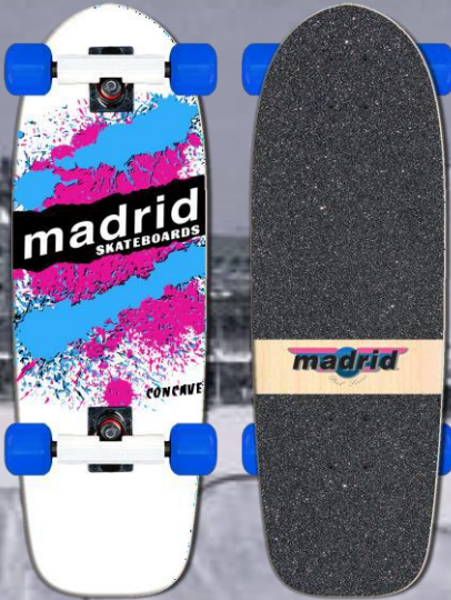
Madrid Skateboard Retro Explosion Weiss