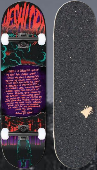
Madrid Skateboard Dezimin Lane 8.25' Kosmischer Wanderer